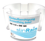
3. 7076 Ralentisseur à l'entrée