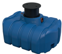
1. 6094 easy rain 1500 diy cuve eau de pluie 1500l plat